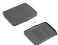
Tapa soporte de bolsa 120 L con tabla porta notas