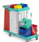
Magic Line 350S