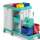
Magic Line 350P