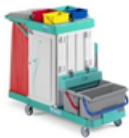
Magic Line 350S7