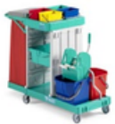
Magic Line 350B