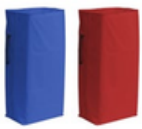
Bolsa plastificada 120 L