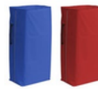
Bolsa plastificada 120 L con cremallera