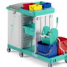
Magic Line 350P